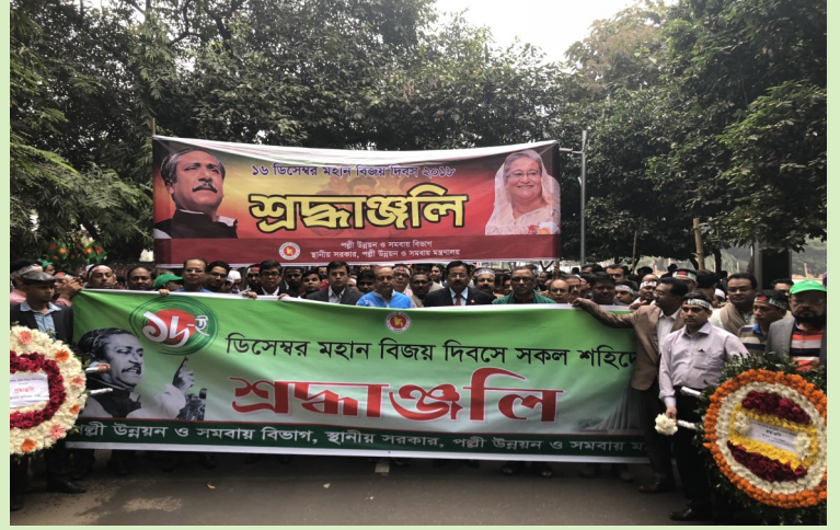
বঙ্গবন্ধু স্মৃতি জাদুঘরে পুষ্পস্তবক অর্পণের লক্ষ্যে র্যালী'তে সচিব পঞ্জী উন্নয়ন ও সমবায় বিভাগ