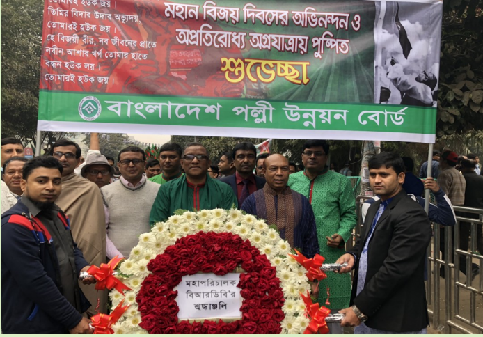
বঙ্গবন্ধু স্মৃতি জাদুঘরে পুষ্পস্তবক অর্পণের লক্ষ্যে র্যালী'তে মহাপরিচালক, বিআরডিবি